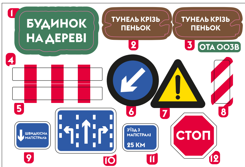
СХЕМА НАКЛЕЮВАННЯ СТІКЕРІВ